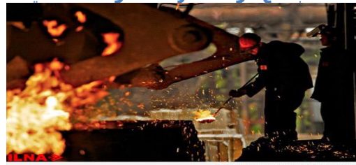
Iranian Labour News Agency

به گزارش خبرگزاری ایلنا، در تاریخ روز جمعه ۲۶ مهر ۹۸ آمده است : واحد تولیدی « مجتمع فولادسازان دماوند » که در زمینه تولید میلگرد فعالیت تولیدی دارد از مهر ماه سال جاری فعالیت دوباره خود را از سر گرفت. برخی منابع کارگری در این واحد تولیدی در استان مازندران با اعلام این خبر گفتند: اواخر مرداد ماه سال ۹۲ واحد تولیدی مجتمع فولادسازان دماوند واقع در منطقه ویژه اقتصادی امیرآباد شهرستان بهشهر به دلیل مشکلات مالی به حالت تعطیلی درآمد. این کارگران با بیان اینکه در آن زمان علت تعطیلی کارخانه «کمبود منابع مالی» عنوان شده